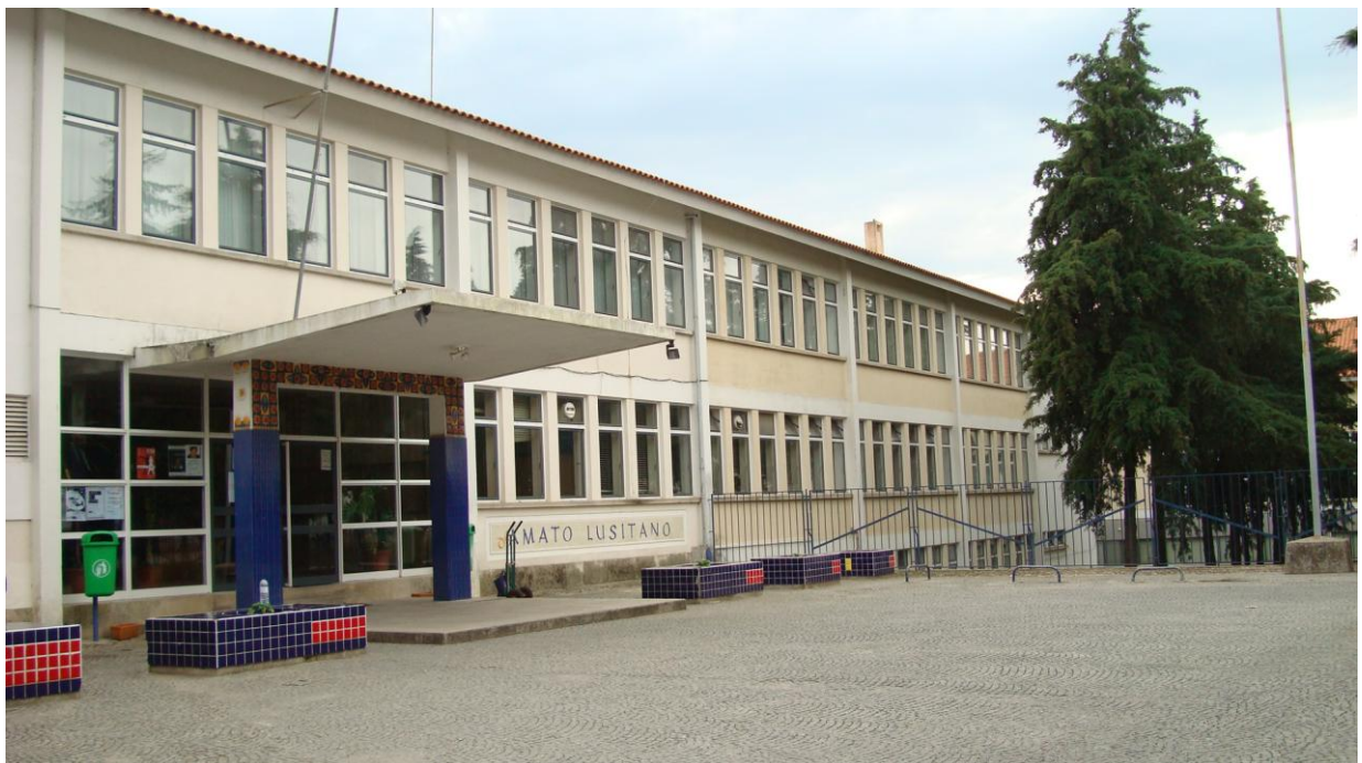
ESCOLA SECUNDÁRIA/3 AMATO LUSITANO CASTELO BRANCO